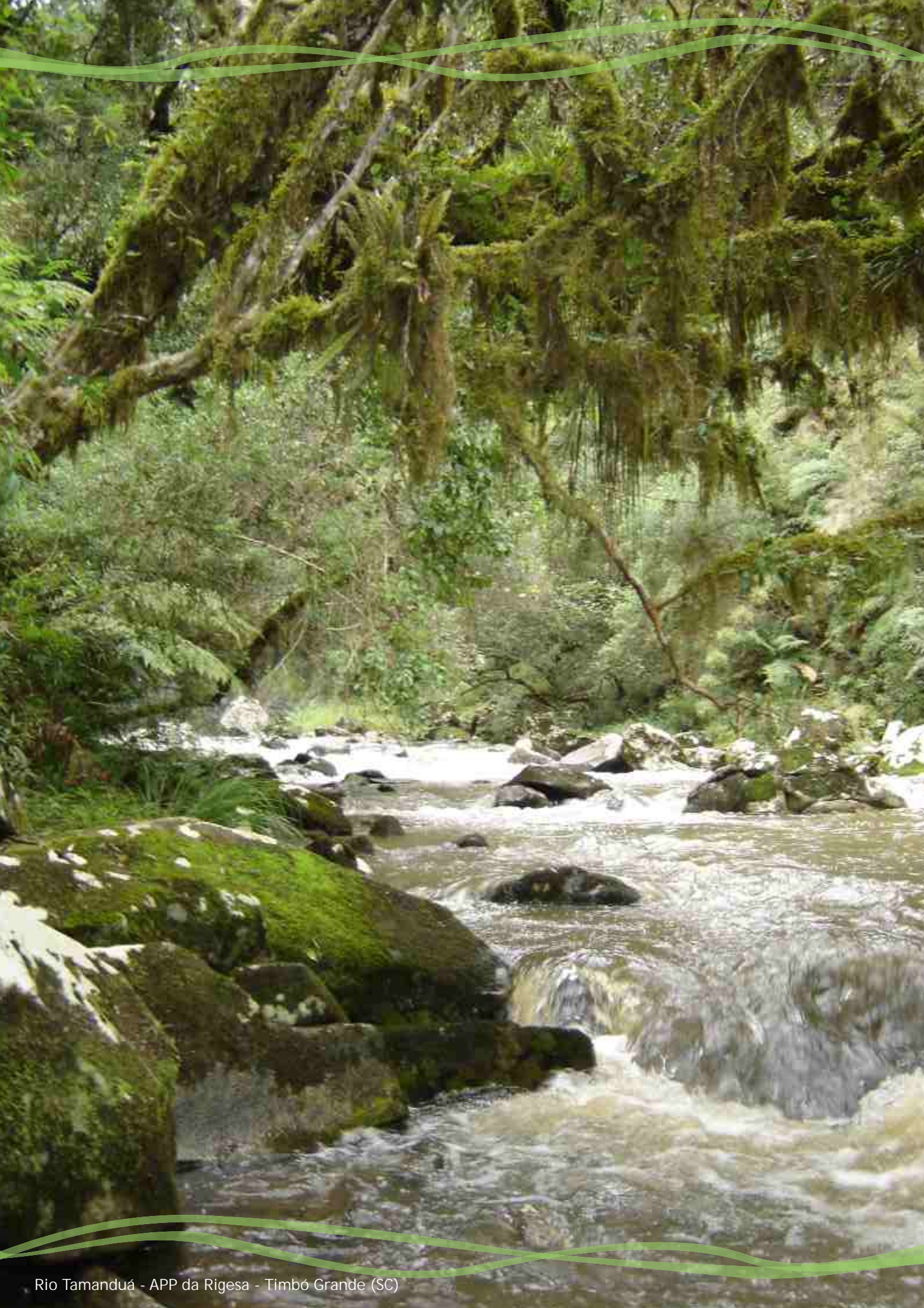
Rio Tamanduá - APP da Rigesa - Timbó Grande (SC)